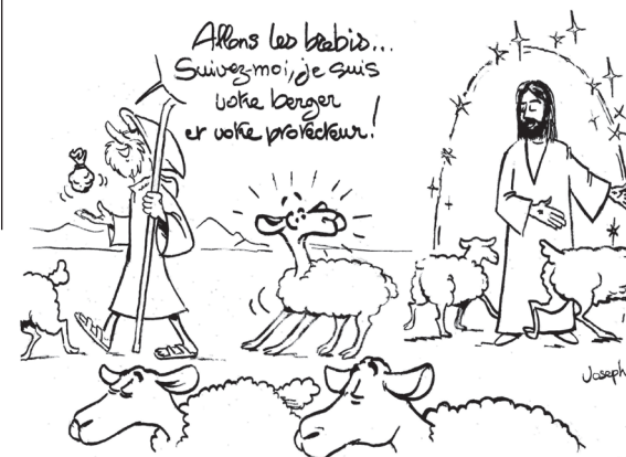
Saint Jean (10, 1-10)