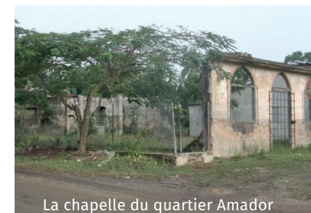
La chapelle du quartier Amador