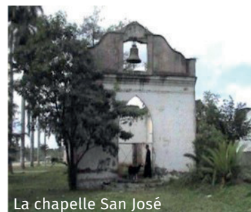
La chapelle San José